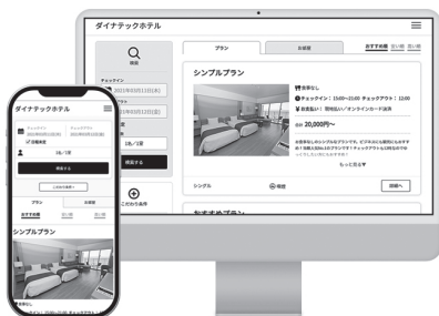
宿泊予約システム Direct In S4

今後同社は、DX支援や自社予約を伸ばし宿泊施設の収益に貢献するべくマーケティング分野にも力を注いでいく。Zホールディングス(株)の一員であり、時代の変化に強い、技術のダイナテックに今後も期待したい。